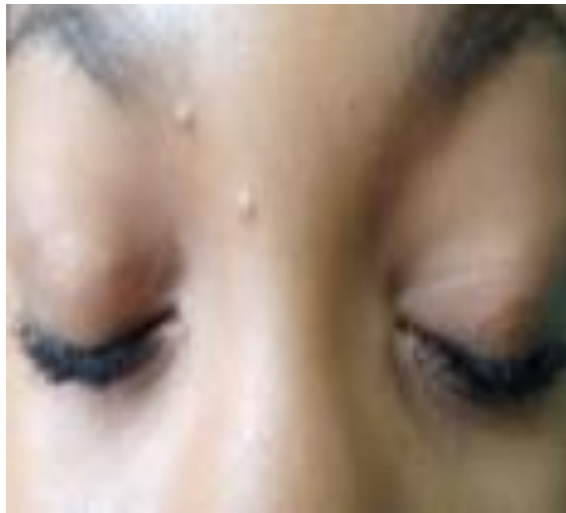
Fig. 1 - Imagen que muestra nódulos en ambos párpados superiores.

Al examen dermatológico se observan múltiples nódulos, no pruriginosos, de 2 - 4 mm de tamaño, que se localizan en ambos párpados superiores. Las lesiones formaban a manera de cordones móviles, indoloros, que no interferían con el cierre del párpado (Fig. 1).