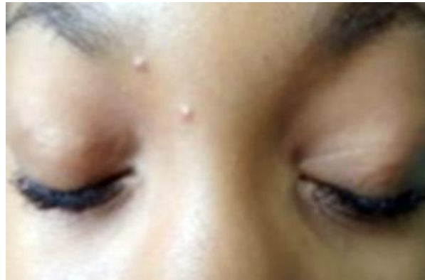
Fig. 1 - Imagen que muestra los nódulos en ambos párpados superiores.

Las lesiones se presentan a manera de cordones móviles, indoloros, que no interfieren con el cierre del párpado.