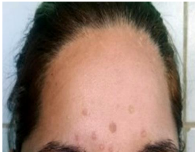
Fig. 1 - Pápulas anulares y placas pigmentadas localizadas en región supraciliar.

Al examen dermatológico se observaron pápulas anulares y placas pigmentadas de diferentes tamaños, entre 0,4 y 2,5 cm, distribuidas simétricamente, localizadas en la región centro facial, que incluyen ambas alas de la nariz (Figs. 1 y 2).