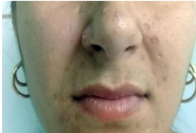
Fig. 2 – Lesiones localizadas en región centro facial, con tendencia a una distribución simétrica.

Se realizaron los siguientes exámenes de laboratorio: Hemograma, Eritrosedimentación, Glicemia, Urea, Creatinina, Ácido úrico, TGP, TGO, LDH, Lipidograma, VDRL, Antígeno de superficie a Hepatitis B, Anti C, VIH. Todos los exámenes se encontraron dentro de límites normales.