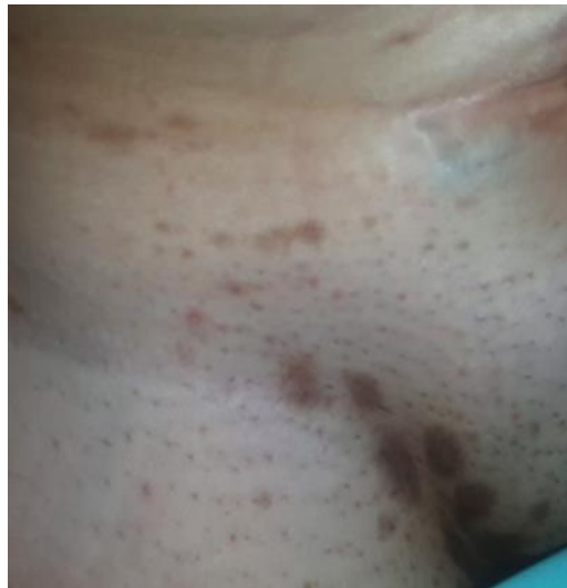
Fig. 1 - Máculas color café de tamaño variable, localizadas en pliegue inguinal.

Al examen físico dermatológico se evidencian máculas color café, de tamaño y forma variables, localizadas en áreas intertriginosas como las axilas y la región inguinal, bilaterales, que se acompañan de prurito (Fig. 1 y 2).