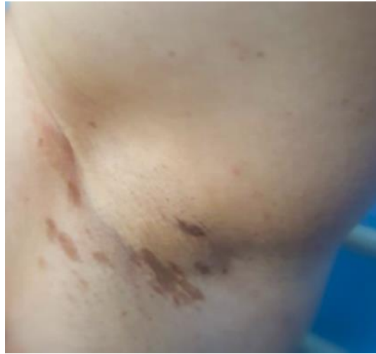
Fig. 2 - Máculas color café, de bordes bien definidos, localizadas en las axilas.

Como dato relevante la paciente usaba múltiples prendas de bisutería.