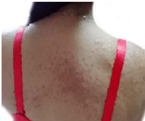
Fig. 1 - Lesiones papulosas, múltiples, pequeñas, del color de la piel y otras, marrón oscuro.

Al examen físico dermatológico: Se observan múltiples lesiones de aspecto papuloso, de 0,3 mm hasta 0,7 mm de diámetro, del color de la piel y otras, marrón oscuro (Fig. 1).