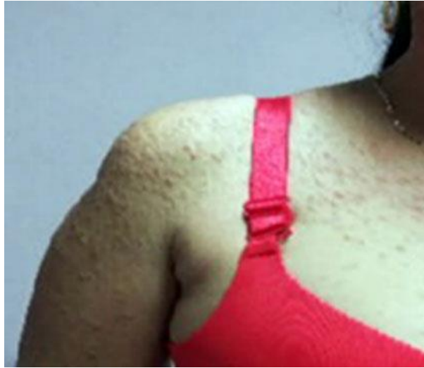
Fig. 2 - Lesiones papulosas agrupadas con disposición lineal.

Algunas se agrupan siguiendo una disposición lineal, unilateral, en hemicuerpo derecho (Fig. 2).