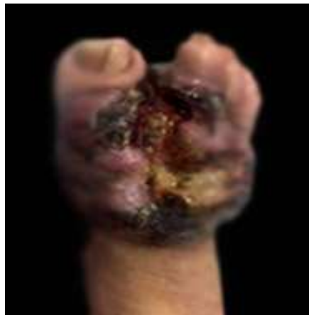
Fig. 2 - Bordes infiltrados, cubiertos en parte por costra necrótica, con centro ulcerado, y presencia de exudado purulento.