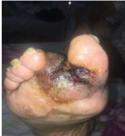
Fig. 1 – Lesión ulcerada, de bordes bien definidos, localizada en pie derecho.