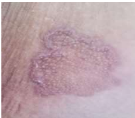
Fig. 1 - Placa anular queratósica e hiperpigmentada de color rojizo, con bordes elevados y centro atrófico.