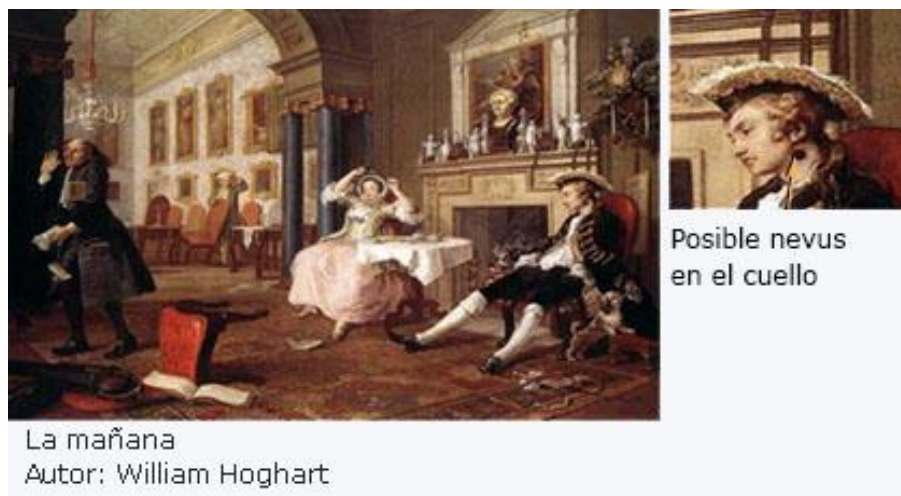
Fig. 4 - Nevus melanocítico.

derecha) una lesión pigmentada de gran tamaño, que pudiera considerarse probablemente un nevus melanocítico (Fig. 4).