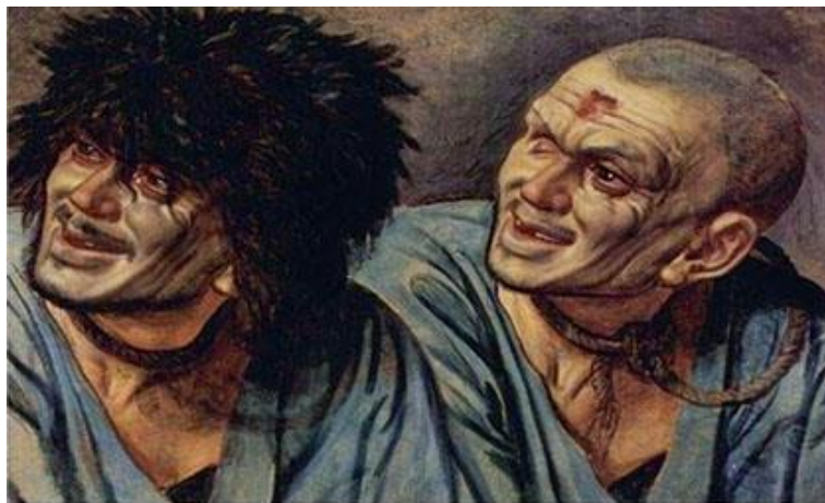
Cabezas de esclavos Autor: Alexander Andreyevich Ivanov

En la siguiente pintura se ilustra la obra de Alexander Andreyevich Ivanov (1806-1858) “Cabezas de esclavos” (c) (Fig. 3). En la frente del personaje de la izquierda se observa una lesión de bordes anfractuados, como cortados a pico, sobreelevados, y de centro ulcerado, que podría corresponder a un carcinoma basocelular. Este tumor suele presentarse en personas con color de piel blanca, expuestas repetidamente al sol. Este tipo de cáncer representa entre el 70 al 80 % de todos los cánceres de piel no melanoma. Su incidencia se incrementa a partir de los 30 años de edad, y afecta más a hombres que a mujeres. Se desarrolla sobre todo en zonas fotoexpuestas, mejillas y nariz. (7)