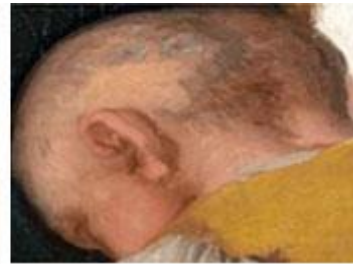
Muchachos trepando a un árbol Autor: Francisco de Goya