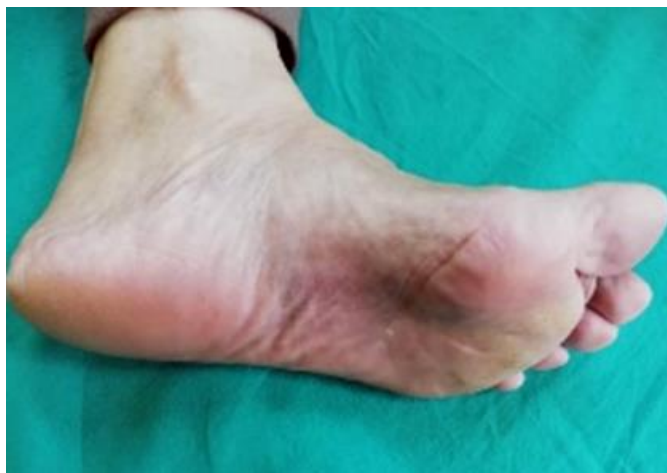
Fig. 3 - Mácula residual al mes tratamiento.

sistémico con dexclorfeniramina (tab 2 mg) una tableta cada 12 h, con resolución total de las lesiones luego del mes de tratamiento (fig. 3).