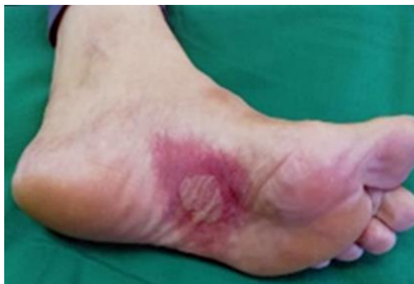
Fig. 1 - Mácula eritematoviolácea de bordes irregulares y difusos en arco plantar del pie izquierdo con presencia de una ampolla central.

En región dorsolateral del mismo pie se observa mácula eritematosa de bordes difusos de más o menos 3 cm de diámetro. Ambas lesiones se acompañan de prurito.