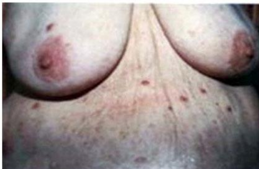
Fig. 2 – Nódulos y pápulas localizadas en tronco.