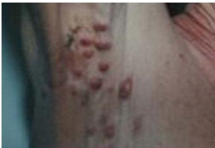
Fig. 1 – Lesiones nodulares, eritematosas, localizadas en axila derecha.